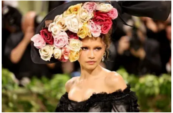
Zendaya, Bad Bunny, Dua Lipa y otras estrellas que deslumbraron con sus extravagantes atuendos en la Met Gala 2024