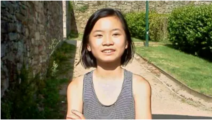
"El caso Asunta": la niña china asesinada por sus padres adoptivos que estremeció a España