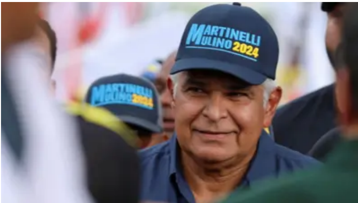
Quién es José Raúl Mulino, el presidente electo de Panamá, y cómo ganó con el apoyo de un exmandatario condenado por lavado de dinero