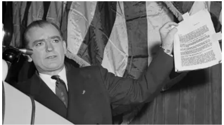
Quién fue Joseph McCarthy, el "inquisidor" anticomunista que lideró la cacería de brujas más recordada del siglo XX en EE.UU.