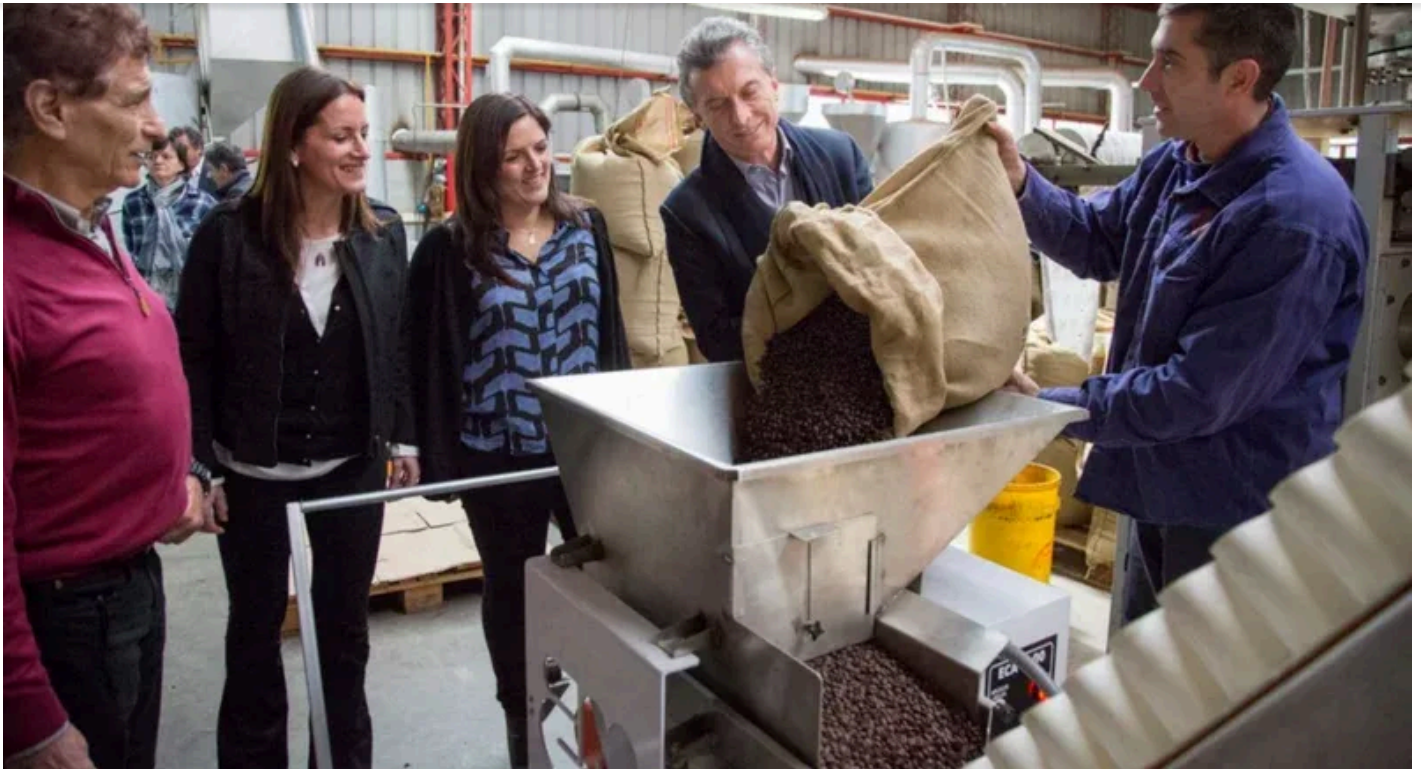
Macri visita una pyme cordobesa destinada a la venta de café.